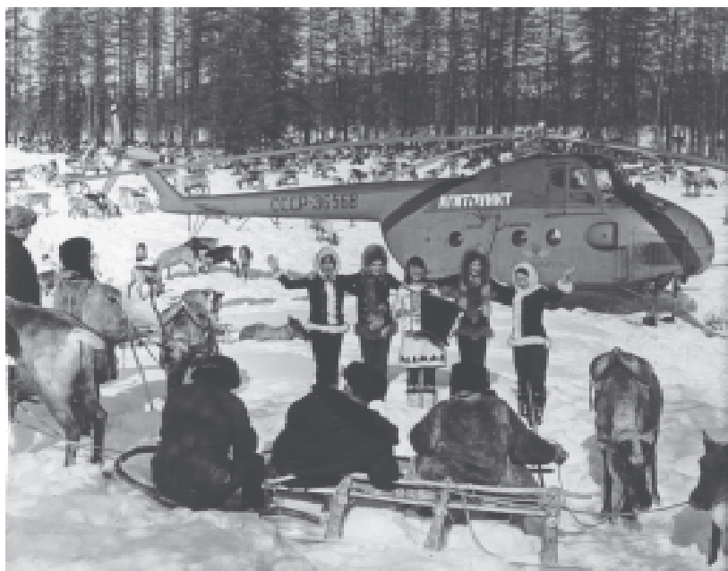
Хабаровский край. Перед оленеводами выступает самодеятельный коллектив села Арки. 1970 год.