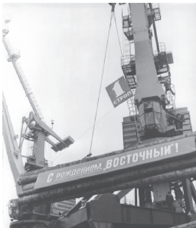
Новые краны в Порту Восточном. 1989 год.