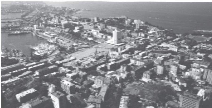
Столица Приморья — Владивосток.