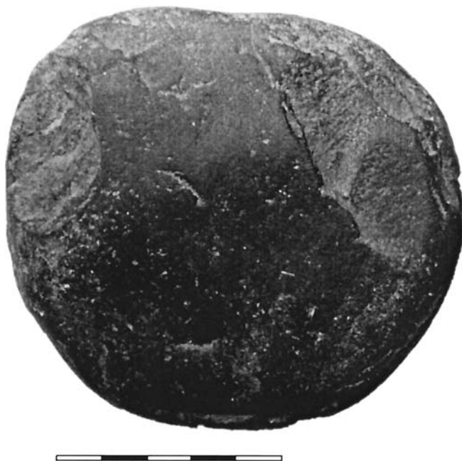
Рис. 4. Бойсмана II, нижний слой, галька-петроглиф (фото).

со стороны нижнего (по отношению к личине) края оформлена сколами как фигура прибрежного краба (рис. 3:2). Галька найдена в квадрате Д 1 /19 на песке древнего пляжа на краю поселения. Рядом, в квадрате Г 1 /21, была найдена роговая фигурка гагары. Размеры второй гальки 10,3×9,4×4 см.