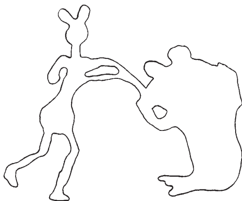
Рис. 2. Изображение медведя и охотника на Свирской писанице [по: 21, с. 325, рис. 99]

исследуемой территории немногочисленны. На Ангаре известны находки неолитических каменных пестов, украшенных головой медведя, вблизи г. Братска (рис. 3, 2) [21, с. 283] и в районе д. Воробьёво [5, с. 231]. На Илеме в культурном слое Березовской стоянки обнаружена скульптура медведя в сидячей позе, вырезанная из оленьего рога [30, с. 117]. Зооморфная скульптура-личина из позднесеровского погребения 11В (развитый неолит) могильника Сарминский Мыс, изготовленная на плоской плитке сланцевой породы, напоминает собой растянутую шкуру медведя. На поверхности скульптуры отмечено четыре отверстия (глаза, нос и рот) (рис. 3, 3) [8, с. 96]. В позднебронзовых погребениях № 22 и 24 могильника Шумилиха