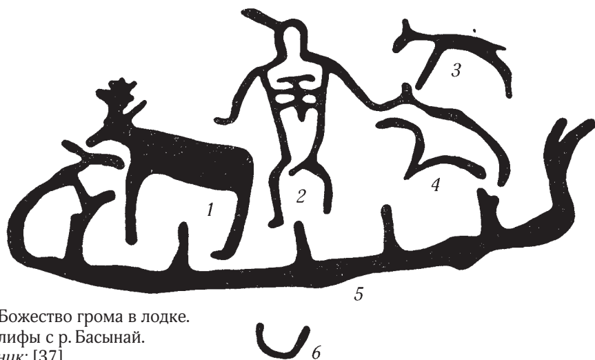
Рис. 4. Божество грома в лодке. Петроглифы с р. Басынай.

для собственно тунгусо-маньчжурских верований. Это представляющий местную традицию трёхпалый человек с оленьими копытами и лучистой головой (возможно, головой медведя). Он помещён среди оленей, ниже расположена фигура, по-видимому, шамана и человека, получающего помощь от божества грома через какой-то ритуал [25, с. 15]. А.И. Мазин сравнивает это изображение петроглифов с шаманской подвеской амурских эвенков, которая имеет вид крылатой антропоморфной фигуры с головой медведя и изображает божество грома Агды [25, с. 13—15]. Эвенки и другие тунгусские народы Амура считали громовника главным шаманским помощником, поэтому прикрепляли его фигурки на шаманской одежде. Это были, например, манегры в виде птицы [Арх. РЭМ. Кол. 4216-484, 489; Макаренко А.А. Материалы экспедиции в Забайкальскую область по теме «Камлание ороchonского шамана». СПб., 1913. Л. 50 // Арх. РЭМ. Ф. 6. Оп. 1. Д. 126, 215, 217, 218]. Изображение грома в образе тигра входило в шаманский комплекс родовых духов-помощников шаманов манегров [Арх. РЭМ. Кол. 464/1,2; 13, с. 59] (рис. 5).