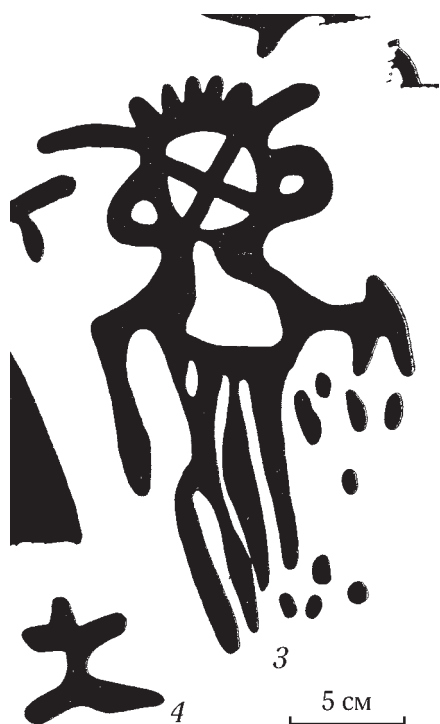
Рис. 2. Бог неба Буга в мужской ипостаси с зооморфными чертами. Петроглифы с р. Токко. Источник: [37]

судя по изображениям на священных скалах, соотносится с образом пляшущих человечков и оградок с точками, символизирующими стадо оленей или животных, а в целом — плодородие природы [34, с. 90—92, 105—116]. На священных скалах Верхнего Амура имеется изображение двух астральных существ солнца, точек — знаков плодородия — и пляшущих человечков [37, с. 181—182]. Ряды последних, нарисованных взявшимися за руки, изображают круговые танцы в честь солнца. Такие человечки были известны и чжурчжэням [11, с. 41, 44—45, 50, 118, 139], у которых сохранилось бронзовое зеркало с двумя небесными богами и пляшущими человечками внизу [29, с. 255]. В середине XX в. у нанайцев и ульчей имелись традиционные танцы, во время которых участники держали в руках круги с изображением розеток красного цвета, символизирующих солнце [19, с. 247—248]. В орнаменте нанайцев и ороков есть образы кругового танца-хоровода, состоящие из четырёх или восьми фигур мужчин и женщин, запечатлённые на праздничном костюме у нанайцев и ровдужных круглых ковриках ороков [Арх. РЭМ. Кол. 10018-68; 51, с. 3—5]. В честь солнца эвенки совершали особые моления [3, с. 10].