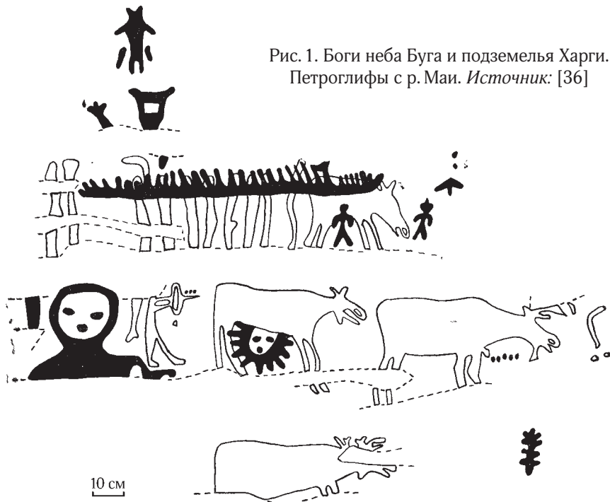
Рис. 1. Боги неба Буга и подземелья Харги. Петроглифы с р. Маи.