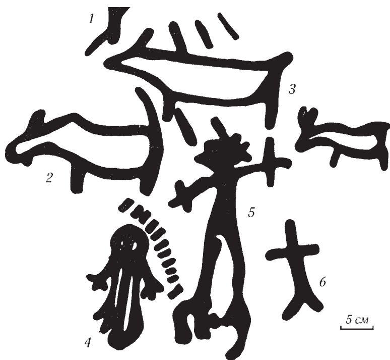
Рис. 5. Бог грома и шаман. Петроглифы с р. Онён. Источник: [37]