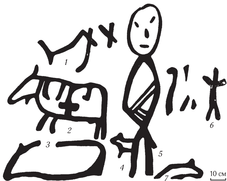
Рис. 6. Бог леса Сэвэки. Петроглифы с р. Онён.