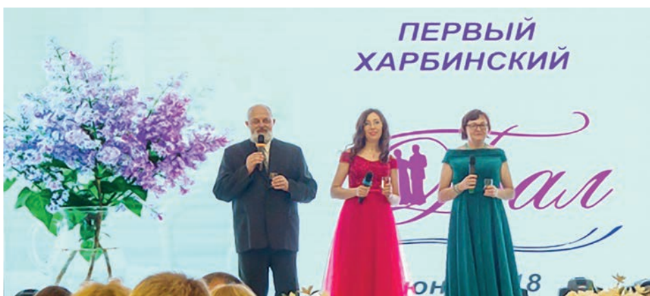
Харбинский бал. Начало концерта