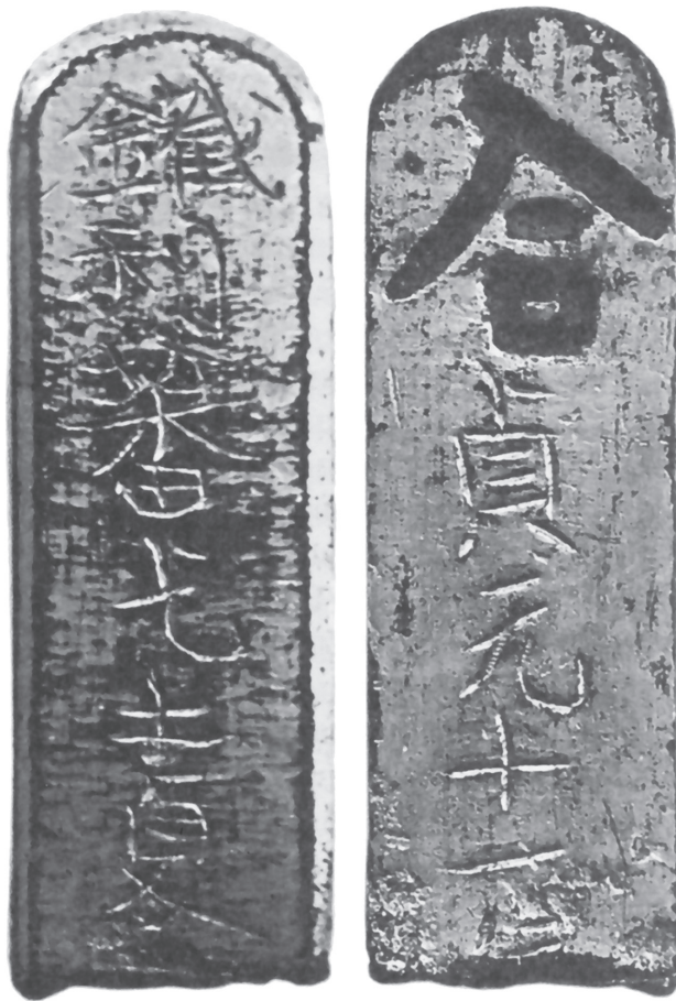
Рис. 1. Бронзовая бирка из Партизанского района Приморского края [1, с. 115]

землях была учреждена область Телифу с шестью подчинёнными округами [5, с. 463]. К концу существования Бохая племя вело самостоятельную политику с киданьской империей Ляо, а позже стало одной из составляющих ядра чжурчжэньского этноса [3, с. 27]. Однако среди исследователей нет единого мнения о месте проживания племени. находка бирки с этнонимом «тели» в Приморском крае дала новую пищу для дискуссии. Это побудило А.Л. Ивлиева провести тщательный обзор китайоязычной литературы на предмет средневековых сведений о племени и предположений современных китайских исследователей о районе его дислокации. Выяснилось, что единого мнения по этому вопросу у учёных из Китая тоже нет. И если для более позднего, ляоского, времени локализация тели ограничивается китайскими специалистами территорией пров. Хэйлунцзян, хотя и разными её частями, то в бохайское время, по их мнению, племя проживало несколько восточней. Так, Цзинь Юйфу помещает его в районе Хабаровска, Вэй Гочжун и Чжу Гочэнь — к востоку от Уссури, Чжан Тайсян