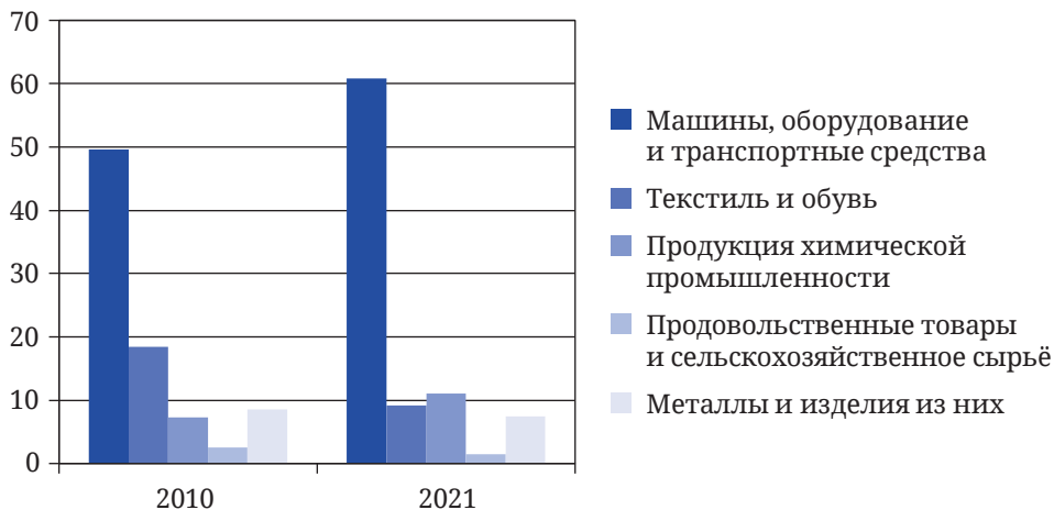
Рис. 3. Структура российского импорта из Китая в 2010 и 2021 гг. (в %). Сост. по: [6; 26]

В структуре российского импорта из Китая серьёзных изменений с 2010 г. также не отмечено (неизменно доминируют поставки машинно-технической продукции), за исключением сокращения импорта китайских текстиля и обуви — как за счёт увеличения доли других стран в импорте этой группы товаров, так и вследствие развития внутреннего российского производства. В целом Китай упрочил свои позиции в качестве одного из крупнейших поставщиков в Россию сложных технических изделий [28] (рис. 3).