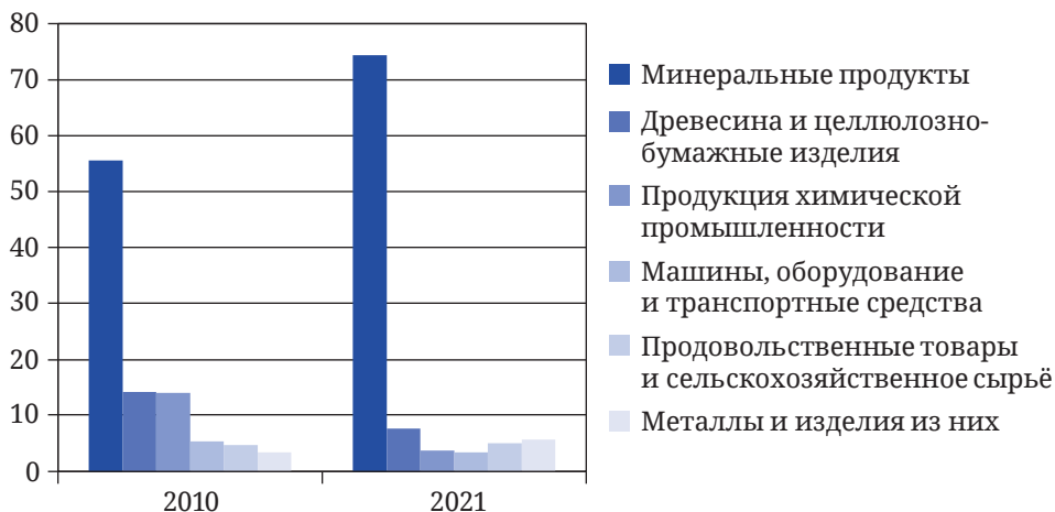
Рис. 2. Структура российского экспорта в Китай в 2010 и 2021 гг. (в %). Сост. по: [6; 26]

пластмассы и изделия из них (на 54% — до 2,9 млрд долл.), мебель (на 63% — до 1,8 млрд долл.), обувь (на 44% — до 2,1 млрд долл.), органические химические соединения (на 31% — до 2,3 млрд долл.) и другие позиции.